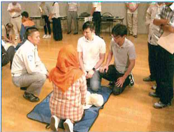
[ 実技講習の様子 ]

講演後は、引き続き、福山地区消防組合 深安消防署の救急隊・消防隊により、心肺蘇生法やAEDの使い方についての実技指導が行われました。受講者の皆さんは、人形や機器を使い心肺蘇生法の実技やAEDの使用方法について、真剣に学んでおられました。